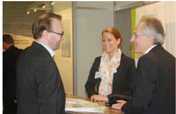
Messestand des Gesundheitsregion KölnBonn e.V.

grierte Onkologie KölnBonn und Vorstandsmitglied des Gesundheitsregion KölnBonn e.V., äußerte dazu als KeyNote-Speaker, es gelte, sämtliche Ebenen von der Forschung bis zur Versorgung zu vernetzen. Eine hohe Bereitschaft zur Interdisziplinarität und zum Arbeiten in Teams ist daher - seiner Meinung nach - notwendig. Personalisierte Medizin müsse als Mannschaftssport verstanden werden. Er vertrat die Ansicht, dass die personalisierte Medizin hinsichtlich Organisation und Logistik viel von der Industrie lernen könne, ohne dabei die Menschlichkeit zu verlieren. Als mögliche Maßnahmen zeigte er unter anderem auf, Forschung und Patientenversorgung zu vereinen, interdisziplinäre Projektgruppen zu bilden und geeignete IT-Strukturen aufzubauen.