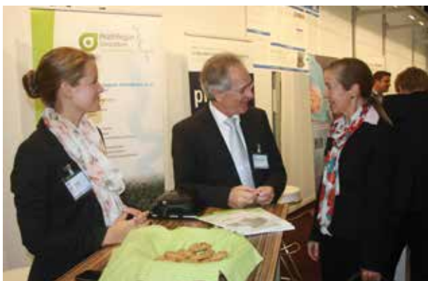
Messestand des Gesundheitsregion KölnBonn e.V.

Das zweitägige Kongressprogramm wurde ergänzt durch einen Messe- und Ausstellungsbereich. Mehr als 40 Unternehmen präsentierten ihre Leistungen und Produkte. Das Business-Lounge-Konzept, in das der Ausstellungsbereich hervorragend integriert wurde, bot den Besuchern viel Raum für persönlichen Austausch und ausführliche Fachgespräche.