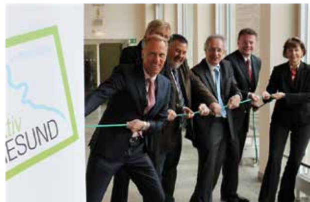
Die Initiatoren des Projektes „aktivGESUND im Rheinland“

Aus dem Arbeitskreis „Gesunde Region“ ist nach einer einjährigen Konzeptionsphase die gemeinsame Initiative der Stadt Köln, der AOK Rheinland/Hamburg, des City Marketing Köln e.V. und der Deutschen Sporthochschule hervorgegangen, das Jahr 2012/13 zu einem ersten Gesundheits- und Präventionsjahr unter dem Motto „aktivGESUND im Rheinland“ auszurufen. Herr Oberbür-