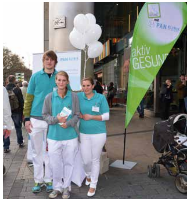
„aktivGESUND im Rheinland“ 2012