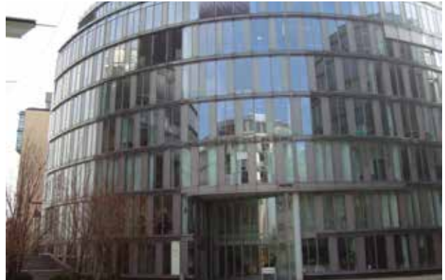
Eingang des Mediapark zu den Geschäftsräumen der Gesundheitsregion KölnBonn e.V.

Den Besuchern des Gesundheitsregion KölnBonn e.V. wird die Anreise erleichtert: die Autobahnen sind nur wenige Minuten entfernt und die Anbindung zu öffentlichen Verkehrsmitteln schafft optimale Voraussetzungen für einen Besuch. Ausreichende Parkmöglichkeiten stehen in der hauseigenen Tiefgarage zur Verfügung. Eine Anfahrtsbeschreibung lassen wir Ihnen gerne zukommen – treten Sie dazu direkt mit uns in Kontakt.