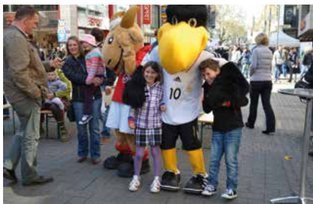
Maskottchen in der Kölner Innenstadt