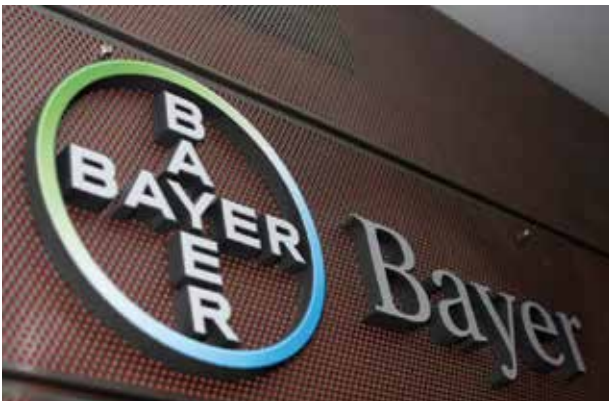
Kamingespräch BayKomm 2012