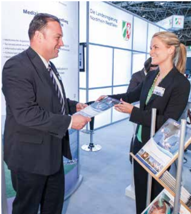
Gemeinschaftsstand des Landes NRW

In Verbindung mit der führenden Fachmesse für den Zuliefermarkt der medizintechnischen Fertigung, der COMPAMED, wurde den Besuchern nicht nur die reine Medizin, sondern ebenso die Cross-Cluster-Innovation an der Schnittstelle von Technik und Versorgung dargestellt.