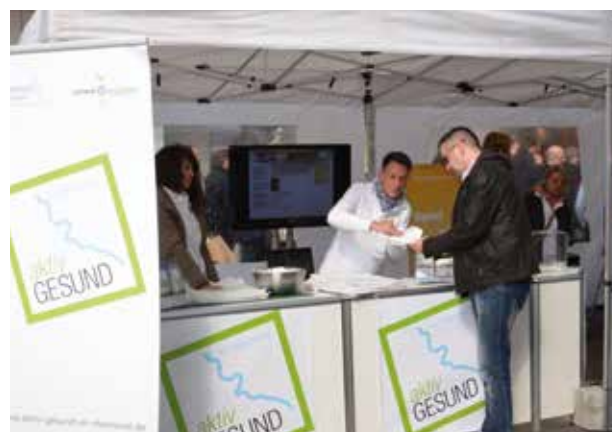
Stand „aktivGESUND im Rheinland“ 2012

Wiederholt wurde die Gemeinschaftsaktion bereits im Juni 2012 am Rande des Internationalen 12-Stunden Laufs im Rhein-Erft-Kreis. Gemeinsam mit der pronova BKK, der AOK Rheinland/Hamburg, dem Institut für Medizinökonomie der Rheinischen Fachhochschule Köln und dem Klettergarten Schwindelfrei, wurde sowohl den Besuchern, als auch den aktiven Läufern ein ebenso buntes Mitmach-Programm rund um die Themen Sport und Gesundheit geboten. Vom Geschicklichkeitstest, über den Test vom Blutdruck und der eigenen Ausdauer, bis hin zu einem gesundheitlichen Rundum-Check der Bioimpedanzanalyse war auch an diesem Aktionstag alles dabei. Die Besucher waren begeistert und nahmen das Angebot rege in Anspruch.