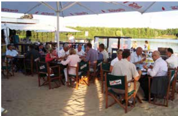
Summer Bird 2012 am Otto-Maigler-See

Bei wolkenlosem Himmel ging die Sonne hinter dem Otto-Maigler-See unter – der perfekte Ausklang eines Sommerabends, den die Teilnehmer zugleich als effektives Netzwerktreffen lobten.