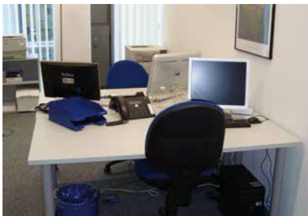
Eines der Büros